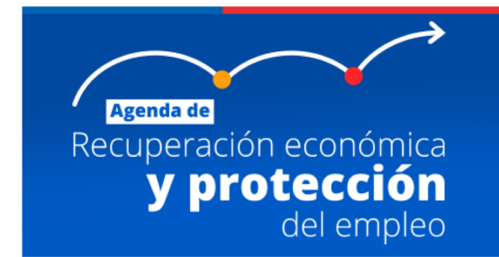
AGENDA DE RECUPERACIÓN ECONÓMICA Y DE PROTECCIÓN DEL EMPLEO