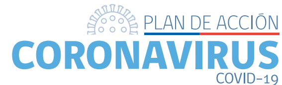
AGENDA DE MEDIDAS PARA ENFRENTAR EL COVID-19