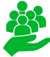
Red Clase Media Protegida