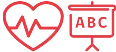
Salud y Educación