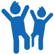
Protección de la Infancia