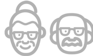
Reforma al sistema de pensiones