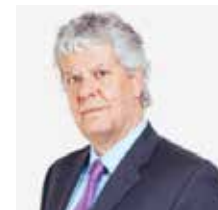
Nicolás Eyzaguirre Ministro Secretario General de la Presidencia

Amigas y amigos, con el mismo empuje y decisión con que hemos sostenido la tarea de estos dos años, quisiera reforzar, a nombre del Gobierno, nuestro compromiso por alcanzar las metas que aún están pendientes y por implementar y consolidar los cambios que ya hemos aprobado.